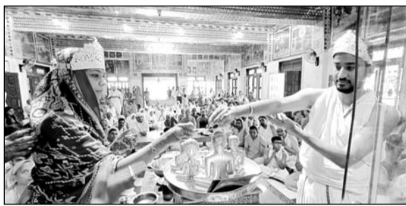
भगवान सुमतिनाथ जन्म तप केवल एवं मोक्ष कल्याणक महामहोत्सव पर विधान किया।

चाहिए। उन्होंने कहा कि जन्म सभी लेते हैं किंतु हमारा जन्म अंतिम नहीं है। सुमतिनाथ भगवान ने तप का पुरस्कार कर धर्म धारण कर मोक्ष प्राप्त किया। जिस प्रकार जेल में बंदी व्यक्ति को रिहा होने पर जो आनंद और खुशी प्राप्त होती है उसी प्रकार कर्मों से बंदी आत्मा जब आजाद कर्म रहित हो जाती है छूट जाती है तब खुशी होती है। उन्होंने कहा कि भगवान भी अनंत भव से कर्मों में बंधे हुए कर्मों से छूटकर मोक्ष प्राप्त करते हैं। मोदक प्रसन्नता का प्रतीक है जो वस्तु