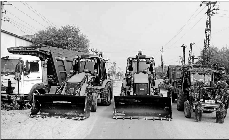
सदर थाना पुलिस ने दो जेसीबी मशीनें व एक ट्रैक्टर ट्राली जप्त की।