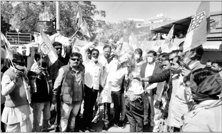
कोटा शहर में जगह-जगह भाजपा के खिलाफ प्रदर्शन किए गए।