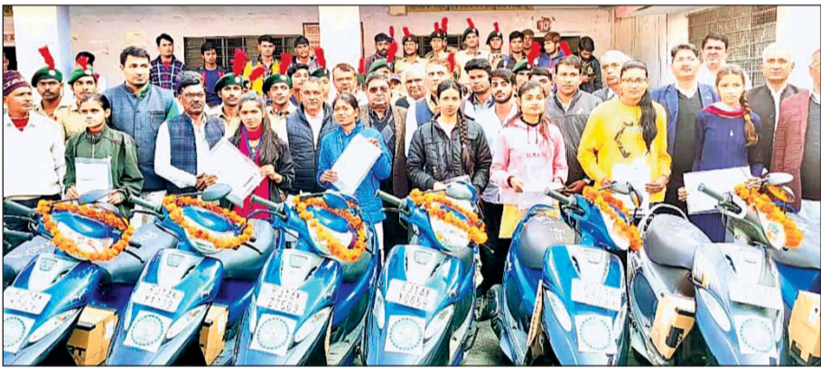
गृह राज्यमंत्री राजेन्द्र सिंह यादव ने छात्राओं को स्कूटी वितरित की।

इस मौके पर मुख्य अतिथि यादव ने कहा कि आधुनिक युग प्रतिस्पर्धा का है। बेटियों को परिवारों का नाम रोशन करती है। उन्हें भी बेटों के समान उच्च शिक्षा का अवसर दें तो समाज उन्नति करेगा। यादव ने राज्य सरकार की जनकल्याणकारी योजनाओं की जानकारी आमजन तक पहुंचाने की बात कहते हुए बताया कि कोरोना काल में भी कोटपुतली क्षेत्र में शिक्षा, चिकित्सा