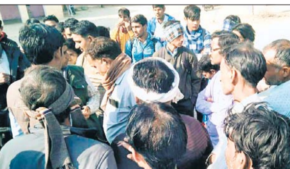
फायरिंग के बाद ग्रामीणों की भीड़ जमा हो गई।

यादव ने बताया कि फायरिंग कर भागते हुए बदमाशों को उन्होंने रोकने की कोशिश की तो बदमाशों ने सरपंच व ग्रामीणों पर गाड़ी चढ़ाने की कोशिश की। वहीं पुलिस ने पंचायत भवन के समीप से एक व संघीय ही खनन क्षेत्र से गोली के दो खोल बरामद किए हैं। छोटे बच्चों और महिलाओं में इतना भय हो गया कि डर के कारण घर से बाहर