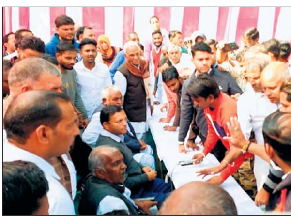
राज्य सरकार के निर्देशानुसार ग्राम पंचायत मुख्यालय पर आयोजित ग्रामसभा में बड़ी संख्या में ग्रामीणों ने भाग लिया।