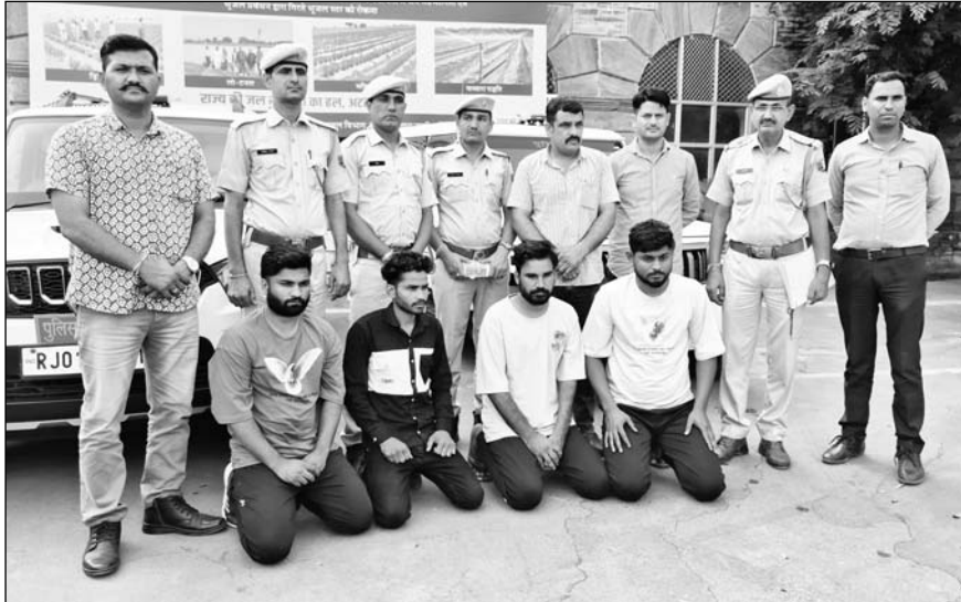
गांधीनगर थाना क्षेत्र में हुई फायरिंग मामले में चार आरोपियों को गिरफ्तार किया।