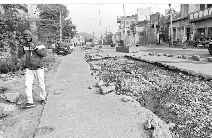
सड़क पर बने गड्डे हादसे को दे रहे न्यौता।