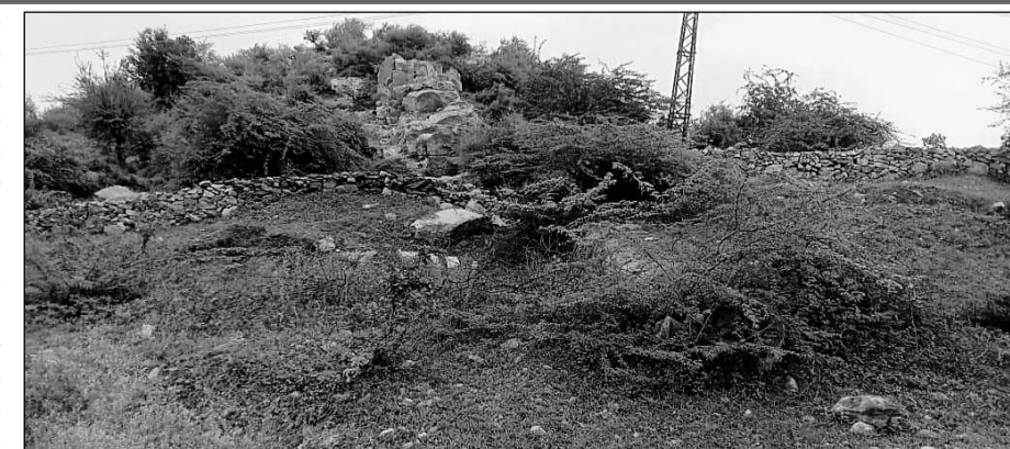
टोंक उपखण्ड के वन रेंज सोहेला में वृक्षारोपण सहित निर्माण कार्यो में जमकर धांधली करने का मामला सामने आया है।

टोंक, (निसं)। टोंक उपखण्ड के वन रेंज सोहेला में वृक्षारोपण सहित निर्माण कार्य में जमकर धांधली करने का मामला प्रकाश में आया है। प्राप्त जानकारी के अनुसार सोहेला वन क्षेत्र में बनी पुरानी दीवार को ही रंगरोगन कर नयी वॉल बताकर लाखों रूपये के फर्जी भुगतान उठाये गये हैं। सोहेला वन्य क्षेत्र में हर साल वन संरक्षण को लेकर प्लान्टेशन का निर्माण कराया जाता है लेकिन वन अफसर नियमों को दरकिनार कर राशि का आहरण करते रहे हैं। ऐसी ही एक कहानी सोहेला वन नका क्षेत्र वैष्णो देवी प्लांटेशन में भारी भ्रष्टाचार देखने को मिल रही है। राष्ट्रीय राजमार्ग 52 पर स्थित वैष्णो देवी मंदिर के पास बनाए गए प्लांटेशन में भारी भ्रष्टाचार किया गया है। उक्त प्लांटेशन पर कई बार प्लांटेशन बनाए जा चुके हैं जबकि अफसरों द्वारा बार-बार नाम