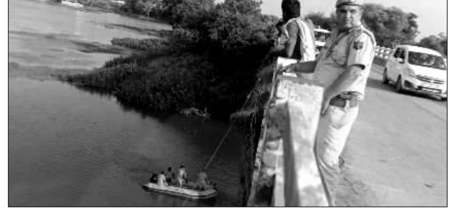
करौली के पांचना पुल के पानी में हथियार की तलाश करते पुलिसकर्मी।