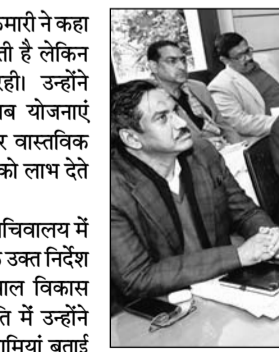
उपमुख्यमंत्री दीया कुमारी ने शनिवार को शासन सचिवालय में महिला एवं बाल विकास विभाग से जुड़े अधिकारियों की बैठक ली।

जयपुर, (का.सं.)। उप मुख्यमंत्री दीया कुमारी ने कहा कि कागजों पर योजनाएं तो अच्छी दिखती हैं लेकिन धरातल पर पहुंची हुई नहीं दिख रही। उन्होंने अधिकारियों को निर्देशित किया कि अब उहाँने केवल कागजों में नहीं बल्कि धरातल पर वास्तविक रूप से आम महिलाओं तथा बालिकाओं को लाभ देते हुए दिखाई देनी चाहिए।