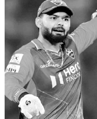
कि दिल्ली आरटीएम कार्ड का इस्तेमाल करे क्योंकि अलग होते संबंधों में दरार आ गई

जेद्दा (सउदी अरब), 23 नवम्बर। आईपीएल 2025 मेगा ऑक्शन 24 और 25 नवंबर को होनी है। इस नीलामी में टीम इंडिया के विकेटकीपर बल्लेबाज ऋषभ पंत सबसे महंगे खिलाड़ी साबित हो सकते हैं। वहीं इस नीलामी में 577 खिलाड़ियों पर बोली लगेगी। आईपीएल की दस टीमों के पास 641.5 करोड़ रुपये का पर्स है और 204 संभावित चयन होने बाकी है। ऐसे में सभी की नजर पंत के नाम पर लगी होगी। पंजाब किंग्स के पास सभी टीमों में से सबसे ज्यादा 110.50 करोड़ रुपये है जबकि आरसीबी के पास 83 करोड़ रुपये हैं। बता दें कि, दिल्ली कैपिटल्स के पास 73 करोड़ रुपये और राइट टू मैच कार्ड है, जिससे वे अपने पूर्व कप्तान को खरीद सकते हैं। वैसे समझा जाता है कि पंत नहीं चाहते