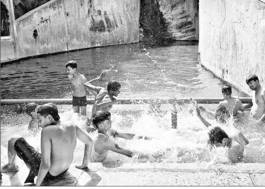
गलताजी कुंड में गुरुवार को भीषण गर्मी से निजात पाने के लिए बच्चे अठखेलियां करते नजर आए।

मानव शरीर ज्यादा दिनों तक दिन और रात का अधिक तापमान नहीं सहन कर सकता। श्रमिकों को धूप में काम करने से इन दिनों बचना चाहिए। हीट स्ट्रोक का खतरा रहता है। पशु-