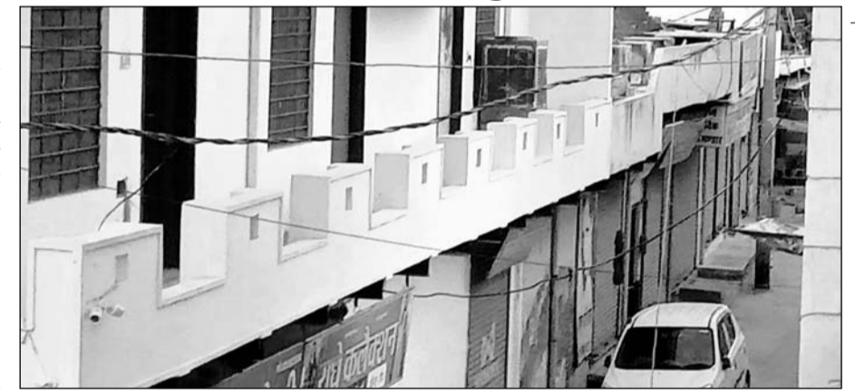
महिला पार्षद का मकान जहां लाइन से डायरेक्ट कनेक्शन ले रखा है।