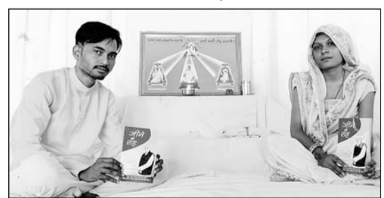
निवाई गंगा गार्डन में आयोजित शादी में मौजूद दुल्हा-दुल्हन।