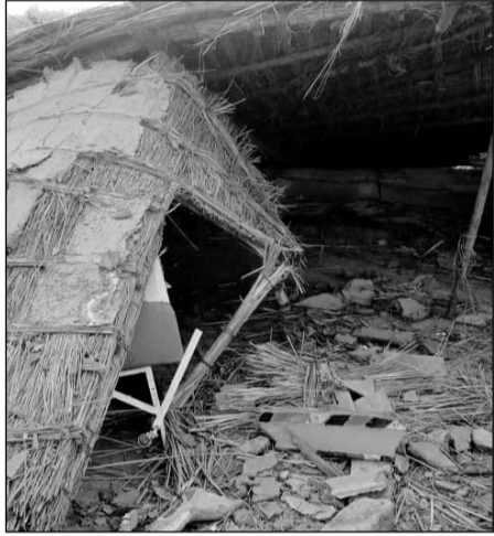
तेज अंधड़ से गिरा छप्पर व फैला मलबा।