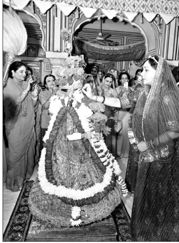
तीज माता की सवारी पूरे हर्ष उल्लास के साथ सिटी पैलेस से निकाली गई। शोभा यात्रा में आएसि व जैल बैंड की ओर से दी गई प्रस्तुतियों से वातावरण गुंजायमान हो गया। दर्शक भी तीज की सवारी देख झूमते हुए दिखाई दिए।