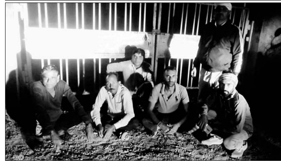
सेफरागुवार जीएसएस का घेराव कर बैठे किसान।

रात के समय 11 बजे से सुबह 4 बजे तक बिजली दी जाती है