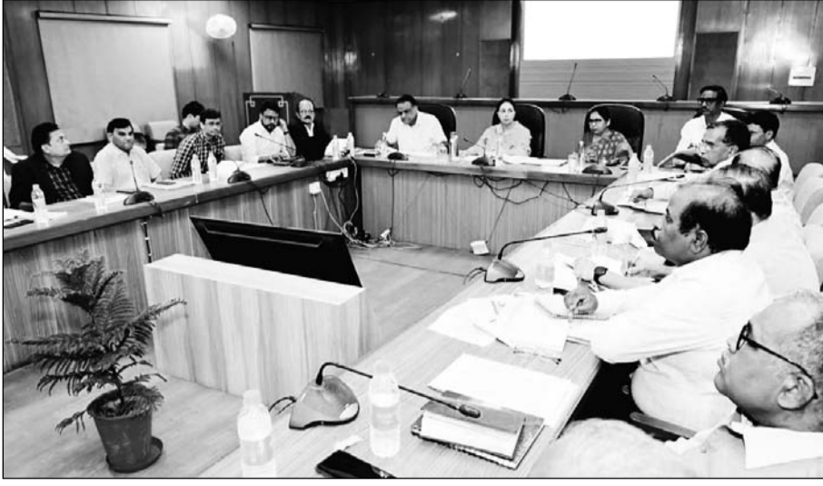
उपमुख्यमंत्री दिया कुमारी ने मंगलवार को निर्माण भवन में आयोजित सार्वजनिक निर्माण विभाग की समीक्षा बैठक को संबोधित किया।

रिपोर्ट प्रस्तुत करेंगे। उपमुख्यमंत्री ने बजट घोषणाओं, एनएचआई, आरएसआरडीसी, आरएसएचए, सीआरआईएफ सहित विभिन्न प्रोजेक्ट्स की गति बढ़ाने और