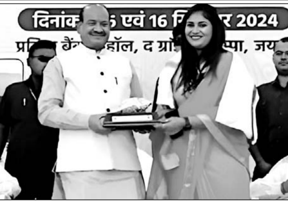
राजसमंद में आयोजित कार्यशाला में लोकसभा अध्यक्ष ओम बिरला, विधायक दीप्ति माहेश्वरी आदि मौजूद रहे।

राजसमंद, (निर्स)। विधायक दीप्ति माहेश्वरी ने राष्ट्रीय वैश्य महासम्मेलन द्वारा आयोजित विकसित भारत 2047-एक दृष्टि और वैश्य समाज विधायक कार्यशाला में भाग लेते हुए कहा कि वैश्य समाज ने हमेशा जातिगत संकीर्णता से ऊपर उठकर राष्ट्र निर्माण में महत्वपूर्ण भूमिका निभाई है। उन्होंने कार्यशाला की सराहना करते हुए कहा कि राष्ट्रीय वैश्य महासम्मेलन विकसित भारत की संकल्पना को साकार करने के लिए समाज में सजगता और एकता लाने का महत्वपूर्ण कार्य कर रहा है। कार्यशाला के मुख्य वक्ता लोकसभा अध्यक्ष ओम बिरला ने भी इस बात पर जोर दिया कि राजनीति और समाज में हमें जाति के आधार पर नहीं बल्कि हमारे कार्यों और समाज में योगदान के आधार पर अपना