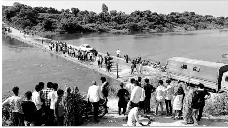
मांडलगढ़ में बीगोद के पास बनास नदी में बहे मां-बेटे के शव 21 घण्टे बाद मिले।