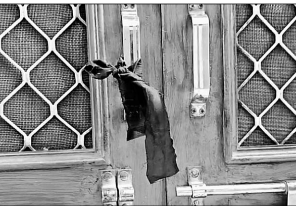
हिंदू समाज के लोगों ने घरों के बाहर विरोधस्वरूप काली पट्टियां बांधी

जानकारी के अनुसार उपनगर सांगानेर में दो दिन पहले गणेश पंडाल पर कुछ लोगों ने पथराव किया, जिससे माहौल गरमा गया था। बीती रात को भी सकल हिंदू समाज के लोगों ने कार्यवाही और कुछ मार्गों को लेकर पुलिस चौकी का घेरा किया, देर रात तक कोई समझौता नहीं हो पाया और सकल हिंदू समाज ने फैसला किया कि वह दूसरे पक्ष के त्योंहार को नहीं देखेंगे। इसी के चलते सोमवार सुबह काली मंगरी चले गए, जहां वह भजन कीर्तन कर रहे हैं और सामूहिक भोज का आयोजन किया