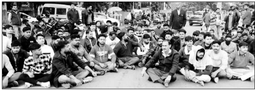
अलवर के प्रमुख नंगली का चौराहे पर राजपूत समाज के लोगों ने जाम लगाकर प्रदर्शन किया।