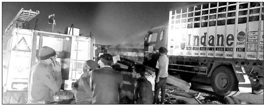
फायर ब्रिगेड के कर्मचारियों ने पानी डाला।

पावटा, (निर्स)। जयपुर से ट्रक में गैस सिलेंडर भरकर कोटकासिम जाते समय मंगलवार शाम में नेशनल हाइवे 48 पर प्रागपुरा थाने के पास