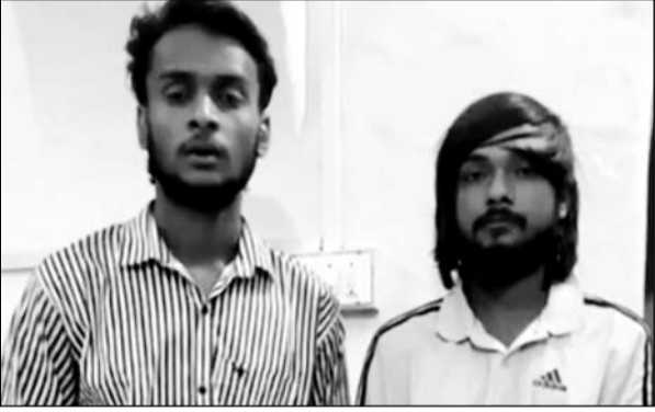
कार में आग लगाने वाले दो आरोपियों को पुलिस ने गिरफ्तार किया।