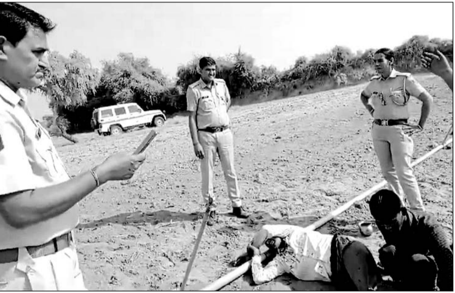
घटनास्थल का वीडियो सामने आया है, जिसमें खेत में एक व्यक्ति अचेत अवस्था पड़ा दिखाई दे रहा है।

गंभीर घायल को सूरजगढ़ के सरकारी अस्पताल में भर्ती करवाया, एक झुंझुं रेफर