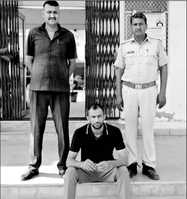
पचेरीकला पुलिस ने फरार आरोपी को गिरफ्तार किया।

खेतड़ी, (निर्स)। पचेरीकला पुलिस ने वांछित अपराधियों की धरपकड़ को लेकर खेलाए जा रहे अभियान के तहत एक आरोपी को गिरफ्तार किया है। आरोपी थाने में दर्ज तीन मामलों में पिछले काफी समय से फरार चल रहा था।