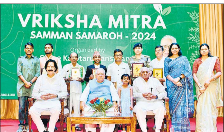
राज्यपाल कलराज मिश्र ने रविवार को श्री कल्पतरू संस्थान की ओर से आयोजित वृक्ष मित्र सम्मान समारोह में संबोधित किया।

जयपुर, (का.सं.)। राज्यपाल कलराज मिश्र ने कहा है कि प्रकृति और पर्यावरण को भारतीय संस्कृति का संरक्षण जरूरी है। उन्होंने अधिकोशिक पेड़ लगाए जाने का आ आ करते हुए कहा कि प्रकृति के आंतरिक संतुलन को क्षति पहुंचाए बिना विकास की सोच को मूर्त रूप दें। उन्होंने कहा कि वृक्ष एवं वनस्पतियां भूमि को उतार और उर्वरा ही नहीं बनाते बल्कि सबका भरण पोषण भी करते हैं।