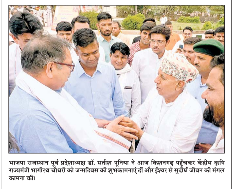
भाजपा राजस्थान पूर्व प्रदेशाध्यक्ष डॉ. सतीश पुनिया ने आज किशनगढ़ पहुंचकर केंद्रीय कृषि राज्यमंत्री भागीरथ चौधरी को जन्मदिवस की शुभकामनाएं दीं और ईश्वर से सुदीर्घ जीवन की मंगल कामना की।