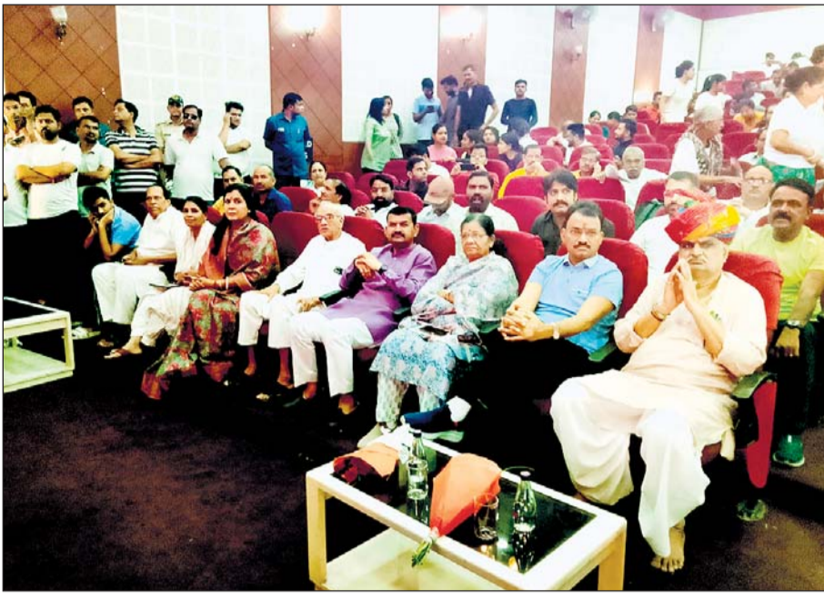
अंतर्राष्ट्रीय योग दिवस के उपलक्ष्य में नगर निगम ग्रेटर महापौर डॉ. सौम्या गुर्जर की पहल पर इंद्रलोक सभागार में रविवार को अखंड योग का विश्व कीर्तिमान बनाने का आगाज किया गया जिसमें 17 जून सुबह 7 बजे तक अखंड योग किया जायेगा। कार्यक्रम का शुभारंभ उपमुख्यमंत्री प्रेमचंद बैरवा, नगरीय विकास एवं स्वायत्त शासन राज्य मंत्री झाबर सिंह खर्वा एवं सांसद (जयपुर शहर) मंजू शर्मा ने किया।

जयपुर योग महोत्सव-2024 के सातवें दिन रविवार को जयपुर के योग साधक विश्व कीर्तिमान बनाने के लिए जुटे। इंद्रलोक सभागार में आयोजित हुए इस कार्यक्रम में पहली बार 80 वर्ष से अधिक बुजुर्गों ने योगासन किया। साथ ही राजस्थान विश्वविद्यालय के छात्रों ने हैरतअंगेज योग का प्रदर्शन करते हुए योग साधकों और कार्यक्रम में मौजूद