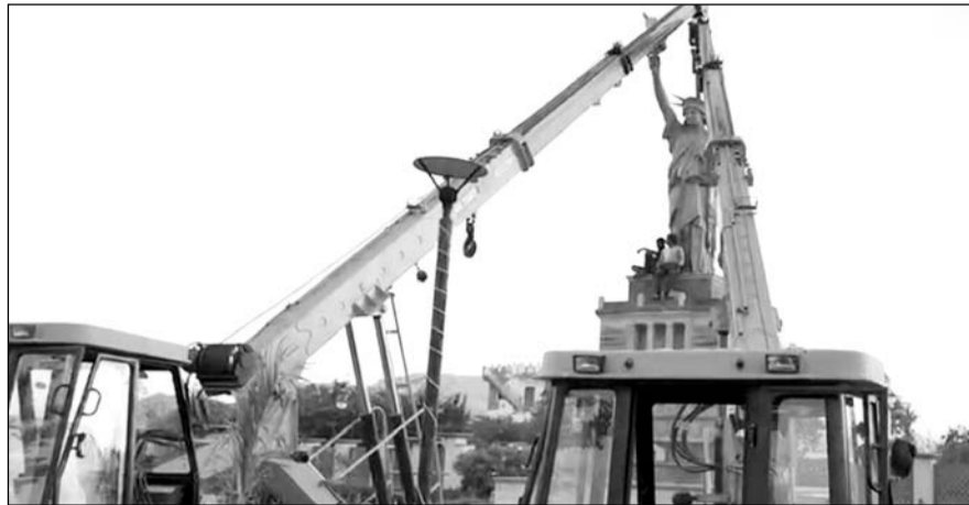
सेवन वंडर पार्क से क्रैन की मदद से स्टेच्यू ऑफ लिबर्टी को हटाया।

अजमेर, (कासं)। सुप्रीम कोर्ट के सख्त रुख के बाद सोमवार को स्थानीय प्रशासन हरकत में आ गया। वेदलैंड स्मार्ट सिटी प्रोजेक्ट के तहत करोड़ों रुपए की लागत से बने सेवन वंडर पार्क से क्रैन की मदद से स्टेच्यू ऑफ लिबर्टी को हटाना शुरू कर दिया है। इससे पहले नगर निगम ने फूड कोर्ट में फर्श और गांधी स्मृति उद्यान में बने पाथ-वे पर जेसीबी का पीला पंजा चलाया। यहां उल्लेखनीय है कि सुप्रीम कोर्ट ने राज्य सरकार व जिला प्रशासन से सवाल किया था कि आनासागर झील के भराव क्षेत्र में हुए अतिक्रमणों को अब तक क्यों नहीं हटाया गया। 9 मार्च को सेवन वंडर पार्क के मुख्य द्वार पर ताला लगा दिया, जिससे पर्यटकों का प्रवेश बंद हो गया था।