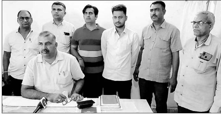
जालोर एसीबी की टीम ने आरोपी को गिरफ्तार किया।