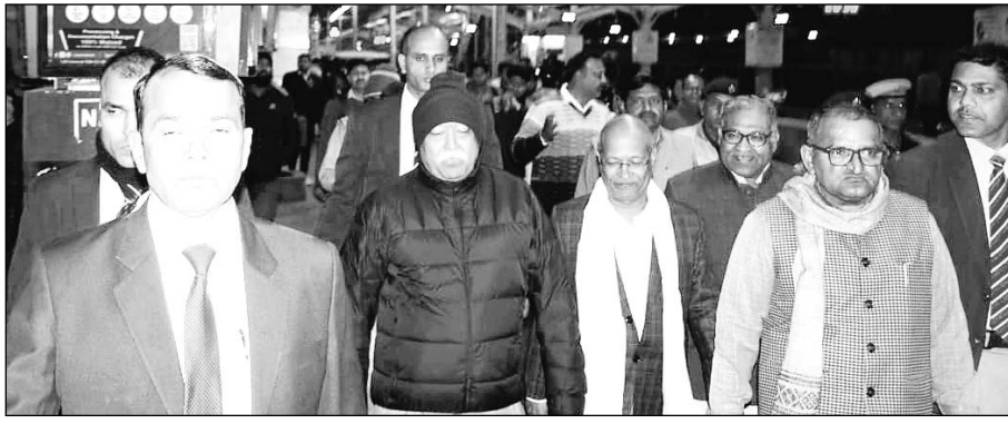
राष्ट्रीय स्वयंसेवक संघ के सरसंघचालक डॉ. मोहनराव भागवत जयपुर प्रांत के पांच दिवसीय प्रवास पर बुधवार रात जयपुर पहुंचे।

इस दौरान संघ के शताब्दी वर्ष की तैयारियों पर भी चर्चा करेंगे। बैठकों में समाज सशक्तिकरण की दिशा में चलने वाली गतिविधियों यथा कुटुम्ब प्रबोधन,