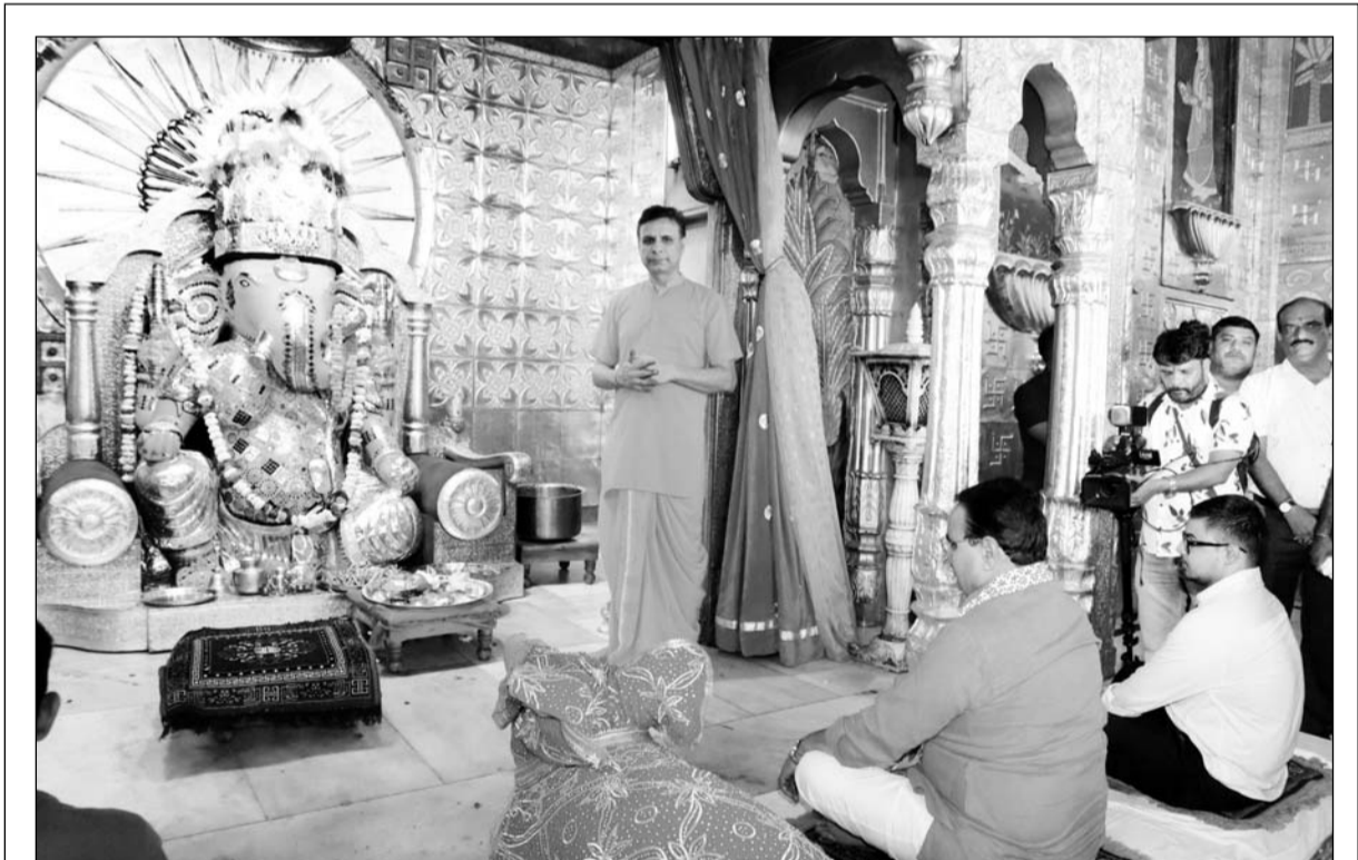
मुख्यमंत्री भजनलाल शर्मा ने गणेश चतुर्थी की पूर्व संध्या पर जयपुर स्थित मोती डुंगरी गणेश मंदिर में मेहेंदी पूजन एवं आरती में शामिल हुए। सिंजारा महोत्सव के अवसर पर गणपति को अर्पित होने वाले शुभ डंके भक्तों को वितरित किये।