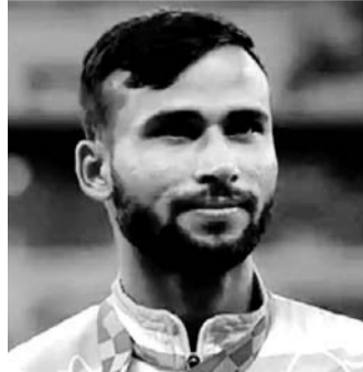
खेलों में भारत के पदकों की संख्या बढ़कर 26 हो गई है।