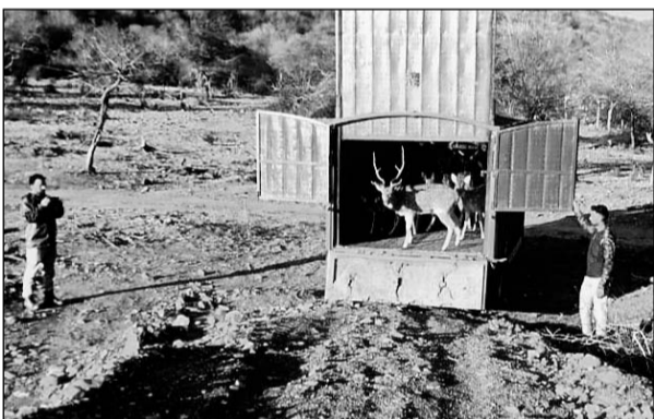
चीतल रामगढ़ विषधारी की जमीन पर कंटेनर से छोड़े गए।