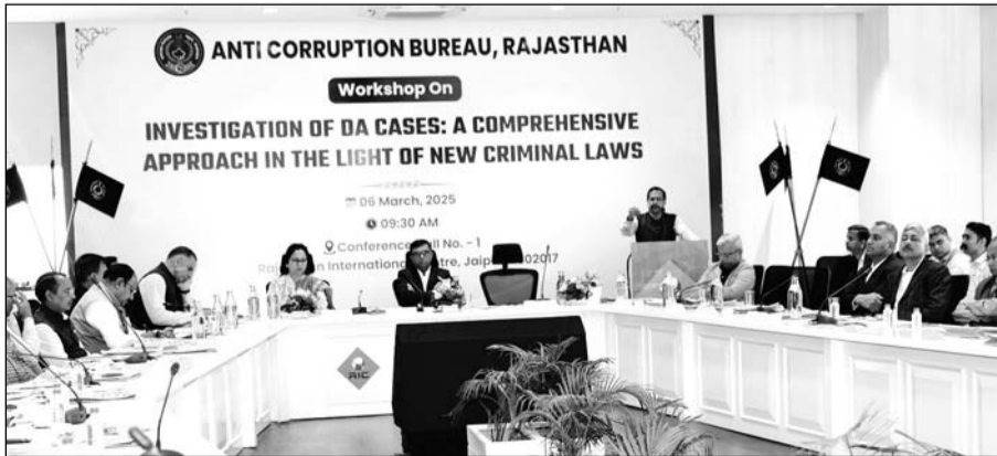
भ्रष्टाचार निरोधक ब्यूरो की ओर से गुरुवार को जयपुर स्थित राजस्थान इंटरनेशनल सेंटर में "इन्वेस्टीगेशन ऑफ डी ए केसेस : ए क्रेप्रेहेंसिव एप्रोच इन दी लाइट ऑफ न्यू क्रिमिनल लॉज" विषय पर कार्यशाला का आयोजन किया गया।

जयपुर। जयपुर स्थित राजस्थान इंटरनेशनल सेंटर में "इन्वेस्टीगेशन ऑफ डी ए केसेस : ए क्रेप्रेहेंसिव एप्रोच इन दी लाइट ऑफ न्यू क्रिमिनल लॉज" विषय पर एक दिवसीय कार्यशाला का आयोजन किया गया।