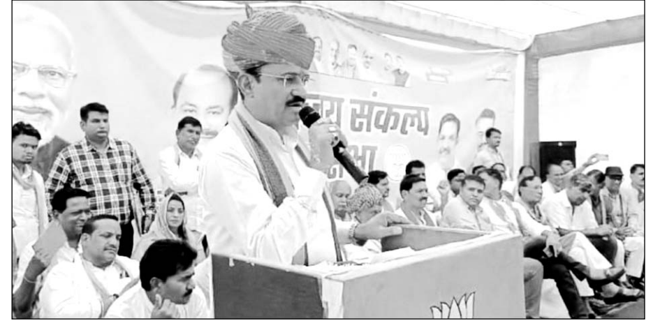
कोटा-बूंदी लोकसभा प्रत्याशी ओम बिरला के समर्थन में उपमुख्यमंत्री प्रेमचंद बैरवा ने आमसभा को संबोधित किया।

उपमुख्यमंत्री डॉ. प्रेमचन्द बैरवा ने भाजपा प्रत्याशी ओम बिरला के समर्थन में तीन सभायें की