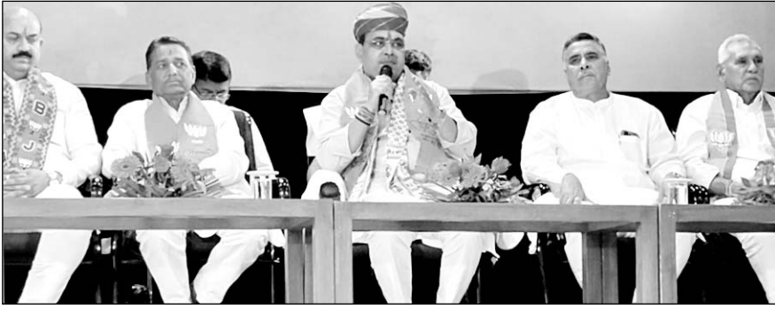
मुख्यमंत्री भजनलाल शर्मा ने भाजपा प्रत्याशी भागीरथ चौधरी के समर्थन में किशनगढ़ मार्बल एसोसिएशन सभागार में कार्यकर्ता सम्मेलन को संबोधित किया।

मदनगंज-किशनगढ़, (निस)। मुख्यमंत्री भजनलाल शर्मा ने भाजपा कार्यकर्ताओं को चुनावी परीक्षा में सफल होने के लिये जीत का मंत्र देते हुए कहा कि प्रधानमंत्री नरेंद्र मोदी के नेतृत्व में लोगों ने प्रचंड बहुमत के साथ भाजपा को जिताने का संकल्प ले लिया है, कार्यकर्ता एकजुटता के साथ प्रत्येक बूथ पर ऐतिहासिक जीत का लक्ष्य तय करें, ताकि प्रधानमंत्री मोदी के सपनों को साकार किया जा सके। मुख्यमंत्री सोमवार को भाजपा प्रत्याशी भागीरथ चौधरी के समर्थन में किशनगढ़ मार्बल एसोसिएशन सभागार में आयोजित कार्यक्रमों सम्मेलन को संबोधित कर रहे थे। उन्होंने कांग्रेस पर प्रहार करते हुए कहा कि दुकान बंद हो चुकी है, केवल झूठ के सहारे लोगों को गुमराह किया जा रहा है। प्रधानमंत्री नरेंद्र मोदी ने कश्मीर में धारा 370 हटाने के अलावा अयोध्या में भगवान श्रीराम को मंदिर में विराजमान करने का