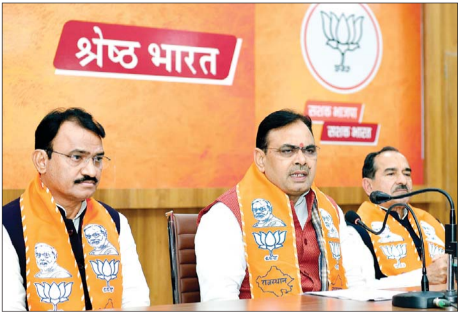
मुख्यमंत्री भजनलाल शर्मा ने भाजपा प्रदेश कार्यालय में प्रेस वार्ता को संबोधित किया। उन्होंने कहा, कांग्रेस पार्टी का इतिहास हमेशा से बाबा साहब डॉ. भीमराव अंबेडकर को अपमानित करने का रहा है और आज यह पार्टी उनके नाम पर हक मांगने का ढोंग कर रही है।

मुख्यमंत्री ने कहा कि कांग्रेस सत्ता लोलुप पार्टी है, केवल सत्ता हासिल करना उसका उद्देश्य है