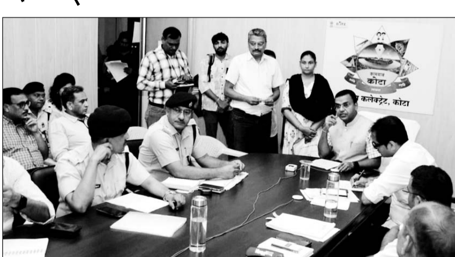
कोटा जिला कलेक्टर ने जनसुनवाई कर आवश्यक निर्देश दिये।

कोटा, (निर्स)। जिला स्तरीय सतर्कता समिति की बैठक एवं जिला स्तरीय जनसुनवाई गुरुवार को कलेक्टर परिसर में आयोजित की गई। जनसुनवाई के दौरान जयपुर से मुख्य सचिव सुधांशु पंत भी जुड़े। उन्होंने जिला कलेक्टरों को निर्देश दिए कि युवाओं को नशे से बचाने के लिए नियमित रूप से नारकोटिक्स की बैठकें आयोजित की जायें साथ ही, उन्होंने यह सुनिश्चित करने का निर्देश दिया कि मेडिकल उपचार के लिए इस्तेमाल की जाने वाली दवाओं का नशे के रूप में दुरुपयोग न हो। जिला कलेक्टर डॉ. रविंद्र गोस्वामी की अध्यक्षता में आयोजित जनसुनवाई में परिवारियों की समस्याओं का सुनकर निस्तारण की प्रक्रिया की गई। मुख्य सचिव पंत ने उर्वरकों के वितरण को प्राथमिकता के आधार पर खेतों के क्षेत्रफल और कमी वाले क्षेत्रों में करने के निर्देश दिए। उन्होंने यह भी कहा कि क्रॉप कटिंग एक्सपेरिमेंट समय पर और निष्पक्षता से कराया जाए ताकि प्रधानमंत्री क्रीडान फसल बीमा योजना का लाभ किसानों तक सही रूप में पहुंच सके। मुख्य लक्ष्य ने सभी जिलों के संपर्क पोर्टल पर निस्तारण की समय सीमा और संतोषजनक निस्तारण की समीक्षा भी की। उन्होंने कहा कि जिला प्रशासन यह सुनिश्चित करे कि जनता