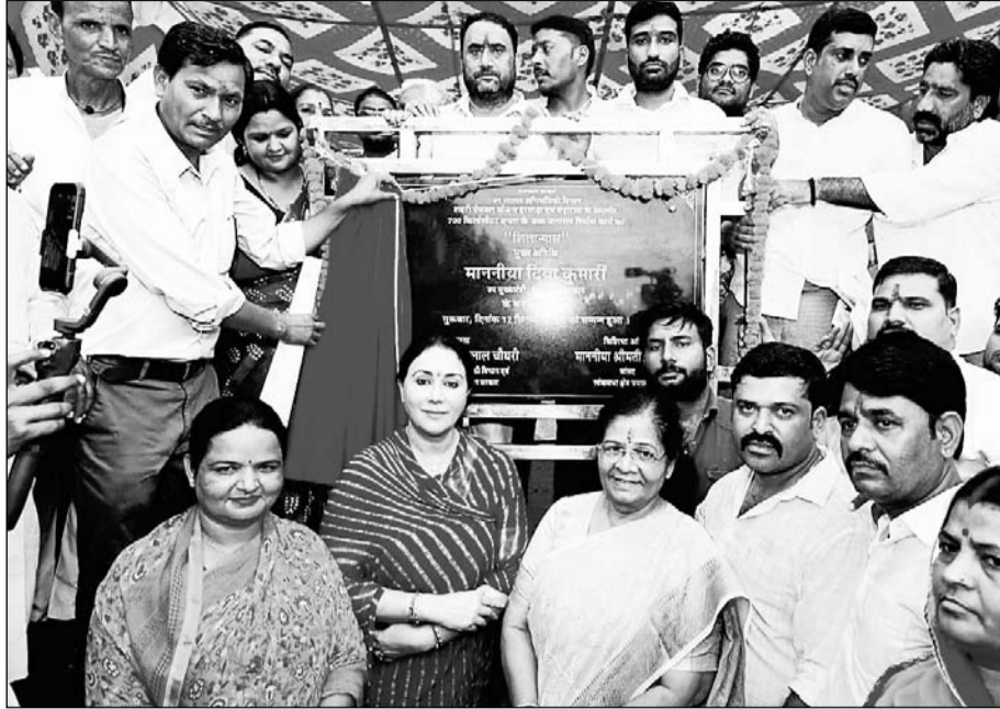
उपमुख्यमंत्री दिया कुमारी ने गुरुवार को विद्याधर नगर विधानसभा क्षेत्र के वार्ड नंबर पाँच और 12 में उच्च जलाशयों का शिलान्यास किया। इस दौरान सांसद मंजू शर्मा भी मौजूद थीं।

■ वार्ड 5 और 12 की लगभग 60 हजार आबादी को मिलेगा बीसलपुर का पानी