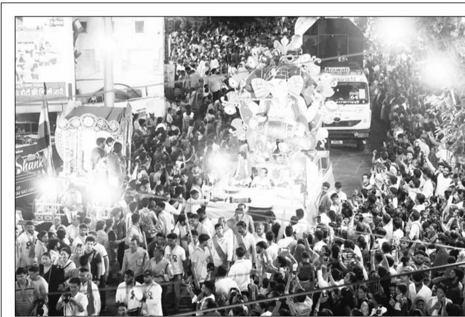
गणेश चतुर्थी के दूसरे दिन बुधवार को मोती डूंगरी गणेश मंदिर से शोभायात्रा निकाली गई। शोभायात्रा को राज्यपाल कलराज मिश्र ने पूजा कर रवाना किया। शोभायात्रा के दौरान भारी भीड़ मौजूद रही। इसमें चंद्रयान-3 की झांकी भी सजाई गई जिसे लोग देखते रहे।