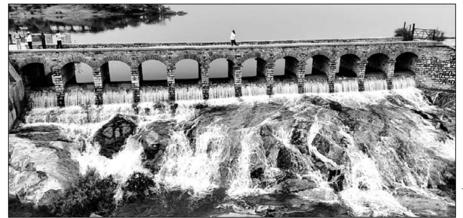
बांध 43 फीट पर हो चुका है, जिले के एक दर्जन बांध पूरे भर गए हैं।

1979 के बाद पहली बार बांध में पूरा भर जाने के बाद ओवरफ्लो हुआ। इसके कमांड क्षेत्र में छोटे-मोटे एनिकट भर जाने के इस बांध में 17 18 फुट से ज्यादा पानी नहीं आता था। इस बार लगातार बारिश से बांध पूरा भर गया, जिसके कारण 10 गांव को अलर्ट कर दिया गया। इसका पानी सिंचाई के काम आता है। इस बांध का निर्माण जोधपुर रियासत के महाराजा सरदार सिंह ने बनाया था जिस कारण इसका नाम सरदार समंद पड़ा। 1933 में जोधपुर महाराजा महाराज उमदे सिंह ने यहां पर कोठी बनाई थी जो कि वर्तमान में हेरिटेज होटल के रूप