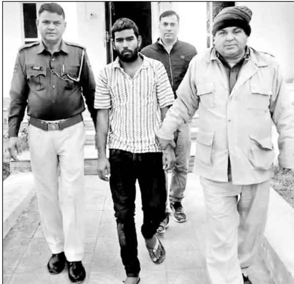
पाटन पुलिस ने चोरी के आरोपी को गिरफ्तार किया।