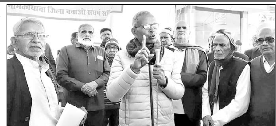
धरने को कई वक्ताओं ने संबोधित किया।

जानकारी के अनुसार जिले को बचाने के लिए मंगलवार को अग्रवाल समाज समिति, विप्र समाज, राजस्थान पेंशनर्स मंच और ग्राम पंचायत नाथा