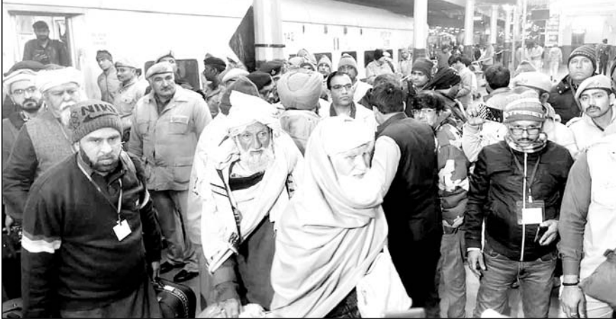
मंगलवार अल सुबह अजमेर रेलवे स्टेशन पहुंचे पाक जायरीन।

अजमेर, (कासं)। विश्व विख्यात सूफी संत हजरत ख्वाजा मोइनुद्दीन हसन चिश्ती के 813 वें सालाना उर्स में शिरकत करने पाकिस्तान से आया 91 सदस्यीय दल मंगलवार अलसुबह अजमेर रेलवे स्टेशन पहुंचा, जहां कड़े सुरक्षा बंदोबस्त के बीच पुलिस ने रोडवेज बसों के माध्यम से पुरानी मंडी सेंट्रल गर्ल्स स्कूल पहुंचाया।