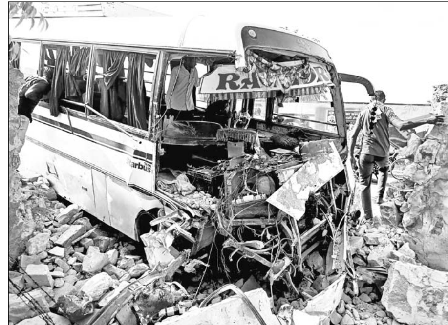
सुजानगढ़ शहर के छापर रोड पर दीवार से टकराई निजी बस।

घायलों को कैम्पर व एंबुलेंस से राजकीय बगड़िया उप जिला अस्पताल लाया गया