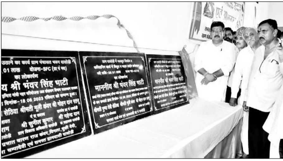
ऊर्जा मंत्री भंवर सिंह भाटी ने दासोड़ी में एक करोड़ रूपये की लागत के विकास कार्यों का लोकार्पण किया।

बीकानेर, (कासं)। ऊर्जा मंत्री भंवर सिंह भाटी ने हर्दा तहसील के दासोड़ी गांव में करीब एक करोड़ रूपये के विकास कार्यों का लोकार्पण किया। इस अवसर पर अपने स्वागत से अभिभूत होकर ऊर्जा मंत्री ने कहा कि मेरा प्रयास है कि कोलायत विधानसभा क्षेत्र विकास की ऊंचाईयों को छुए। उन्होंने कहा कि गत साढ़े चार सालों में कोलायत विधानसभा क्षेत्र में आधारभूत सुविधा के विकास पर जोर रहा है। इस इलाके के विकास की ओर ज़रूरत है। उन्होंने कहा कि दासोड़ी गांव के युवा मण्डल द्वारा लिया गया शराबबंदी का निर्णय सराहनीय है। गांव वालों को इस पर कायम रहना है।