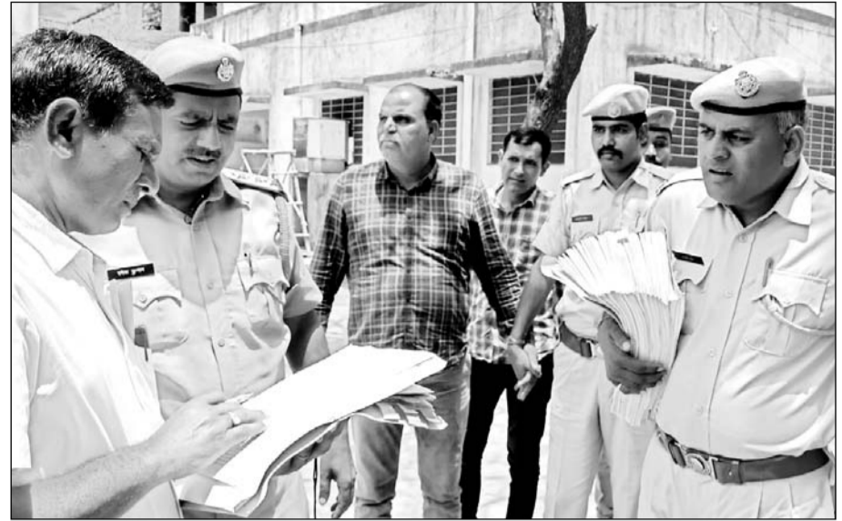
रीट प्रकरण में आरोपी को पेश करने ले जाती एसओजी।

रीट पेपर लीक मामले में 2 और आरोपी जालोर से गिरफ्तार