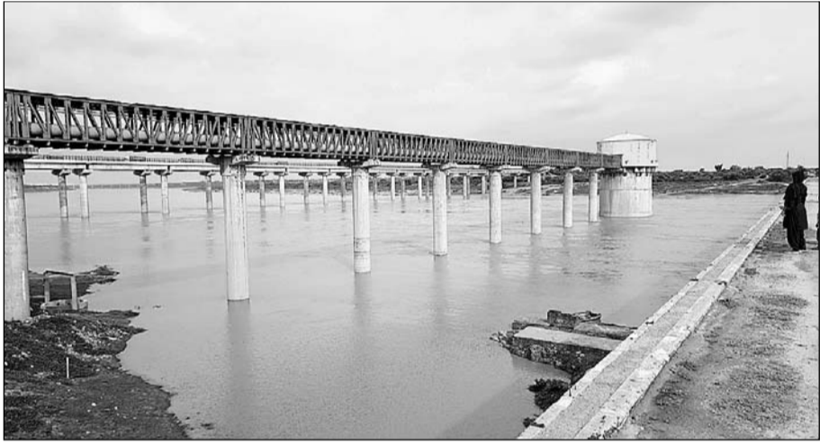
हाड़ौती क्षेत्र में हो रही लगातार बरसात से धौलपुर में चंबल का जल-स्तर बढ़ा।

धौलपुर, (निसं)। धौलपुर जिले से होकर गुजर रही चंबल नदी का जलस्तर अब धीरे-धीरे बढ़ने लगा है। हालांकि अभी चंबल नदी का जलस्तर खतरे के निशान से काफी दूर है, आम जन को सचेत जरूर