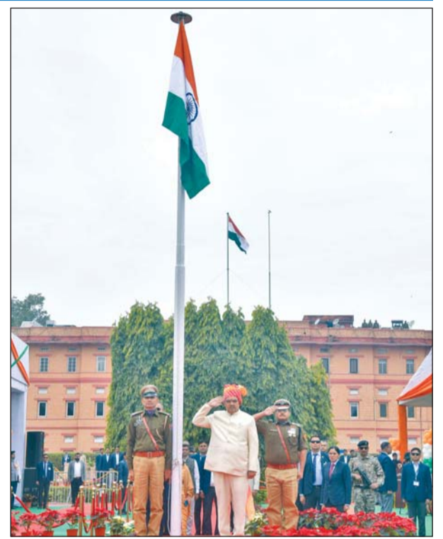
मुख्यमंत्री भजनलाल शर्मा ने गणतंत्र दिवस पर राजस्थान सचिवालय कर्मचारी संघ की ओर से शासन सचिवालय में आयोजित समारोह में राष्ट्रीय ध्वज तिरंगा फहराया।

कल्याण की भावना को धरातल पर उतार रही है और उनके मार्गदर्शन में राज्य सरकार ने गरीब, किसान, महिला और युवा वर्ग के उत्थान एवं सशक्तीकरण के लिए अनेक महत्वपूर्ण कदम उठाए हैं। उन्होंने यह बात सोमवार को गणतंत्र दिवस पर राजस्थान सचिवालय कर्मचारी संघ की ओर से शासन सचिवालय में आयोजित समारोह को संबोधित करते हुए कही। उन्होंने इस अवसर पर राष्ट्रीय ध्वज तिरंगा फहराया और राष्ट्रपिता महात्मा गांधी की प्रतिमा पर पुष्प अर्पित कर उन्हें श्रद्धांजलि दी।