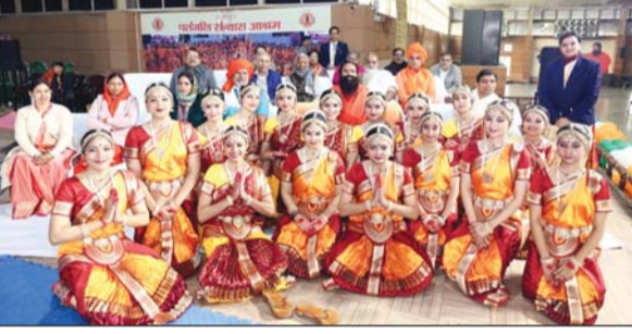
पंतजलि योगपीठ में स्वामी रामदेव व महामंत्री आचार्य बालकृष्ण ने पंतजलि वेलनेस, फेस-2 में ध्वजारोहण किया और 77वें गणतंत्र दिवस मनाया।

हरिद्वार। पंतजलि योगपीठ में स्वामी रामदेव व महामंत्री आचार्य बालकृष्ण ने पंतजलि वेलनेस, फेस-2 में ध्वजारोहण कर देशवासियों को देश के 77वें गणतंत्र दिवस की शुभकामनाएं दीं। उन्होंने कहा कि "भारत मजबूत होगा तो पूरी दुनिया में कोई हिंदुओं पर अत्याचार नहीं कर पाएगा। एक देश, एक संविधान, एक झंडा, एक संकल्प, एक भारत, श्रेष्ठ भारत होगा, तभी तो स्वस्थ, समृद्ध, संगठित, विकसित भारत बनेगा।" स्वामी रामदेव ने स्वदेशी शिक्षा, स्वदेशी चिकित्सा, स्वदेशी अर्थव्यवस्था, स्वदेशी सनातन जीवन पद्धति तथा स्वदेशी से स्वावलम्बी विकसित भारत-पञ्चप्रण लेते हुए राष्ट्रसेवा की बात कही। उन्होंने कहा कि कहीं टैरिफ