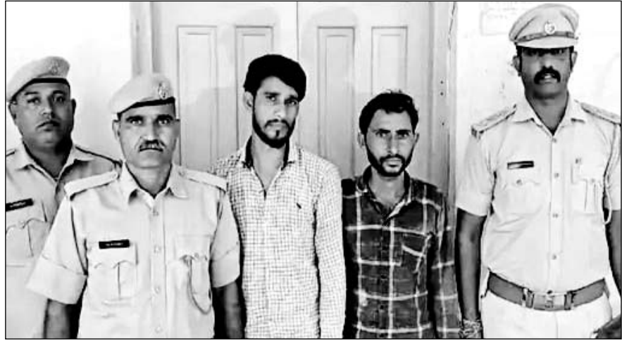
सरिस्का के बफर ज़ोन में करंट लगाकर शिकार करने वाले दो शिकारियों को गिरफ्तार किया।

रेंजर शंकर सिंह ने बताया कि 16 अक्टूबर की रात को सिरावास में बफर ज़ोन के जंगल के पास खेत में तार लगाकर करंट छोड़ने की सूचना मिली थी। पता लगा था कि कुछ युवक जंगली सूअर व सांभर शिकार करने आए हैं। जिन्होंने खेत में तार लगा करंट छोड़ रखा है। इसके