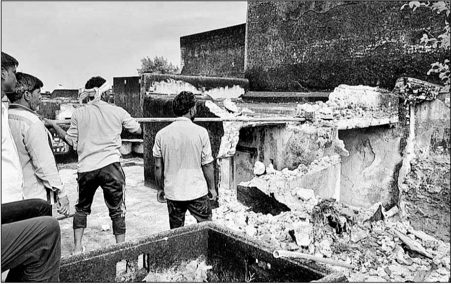
सांभर के वाई 22 में जर्जर हवेली के हिस्से को पालिका की ओर से गिराने का काम शुरू हुआ।