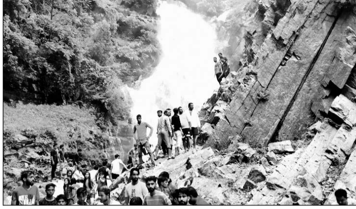
बीसलपुर रोड पर स्थित भैरू झाम झरने पर मनोरंजन करते पर्यटकों।

टोंक, (नि.स)। जिले के टोडारासिंह में गत आदि शहरों से बड़ी संख्या में रमणीक स्थलों से दर्जनभर झरने फूट पड़े। रविवार का अवकाश होने से सुबह से ही बड़ी संख्या में लोगों की भीड़ जुटना शुरू हो गई। वहीं सुबह से ही चौपहिया वाहनों की कतार लगने लगी। कस्बे से बीसलपुर रोड पर पहाड़ से करीब दर्जनभर झरने गत दो दिनों से चल रहे हैं। जिसमें मुख्य रूप से भैरू झाम, हाथ खल्ला, मसानिया खल्ला, जोगिडा सहित अन्य शामिल हैं। वहीं बीसलपुर तक करीब 13 किमी रास्ते पर कई जगहों पर छोटे छोटे झरने भी फूट रहे हैं।