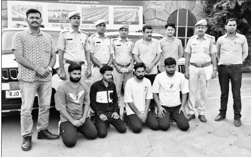
गांधीनगर थाना क्षेत्र में हुई फायरिंग मामले में चार आरोपियों को गिरफ्तार किया।