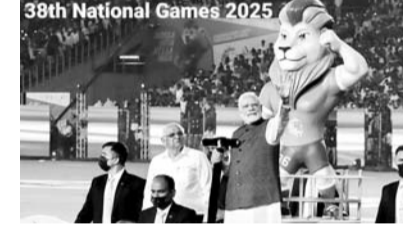
लोगों के साथ ही कार्यक्रम में शिव तांडव नृत्य भी हुआ। उससे पहले में हिमालय हूँ की डॉक्यूमेंट्री दिखाई गई।

देहरादून, 28 जनवरी। उत्तराखंड की राजधानी देहरादून में 38वें राष्ट्रीय खेलों का आगाज हो गया है। इस दौरान राजीव गांधी अंतर्राष्ट्रीय क्रिकेट स्टेडियम में पीएम मोदी ने समारोह में खेला का शुभारंभ किया। सोपम धामी ने पीएम मोदी का सिल्वरवापर पर लिखी किताब, शाल और उत्तराखंड की पारंपरिक टोपी पहनाकर स्वागत किया। वहीं जब पीएम मोदी स्टेडियम में पहुंचे तो लोगों ने खास उत्साह दिखाया। पीएम ने दर्शन दीर्घा से हाथ हिलाकर धन्यवाद किया। स्टेडियम में मोदी मोदी के नारे लगे तो वहीं जय श्री राम के नारे भी