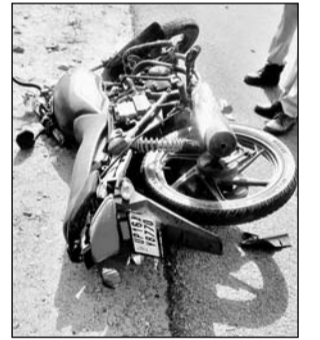
हादसे के बाद क्षतिग्रस्त बाइक।

परिजन आने के बाद बुधवार को शवों का पोस्टमार्टम करवाया जायेगा। परिजनों द्वारा रिपोर्ट देने के बाद जांच शुरू की जायेगी। जानकारी मुताबिक