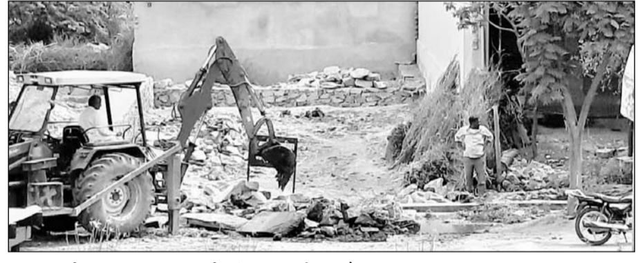
अस्पताल रोड पर अतिक्रमण हटाने की खानापूर्ति कर लौटा पालिका दस्ता।