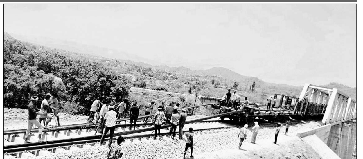
उदयपुर-अहमदाबाद बॉडगेज पर काम करते मजदूर।

पूरा हो चुका है। अभी खारवा से जयसमंद के बीच सीआरएस होना बाकी है। संभवतः इसी माह सीआरएस निरीक्षण किया जा सकता है। सीआरएस निरीक्षण के बाद रूट पर