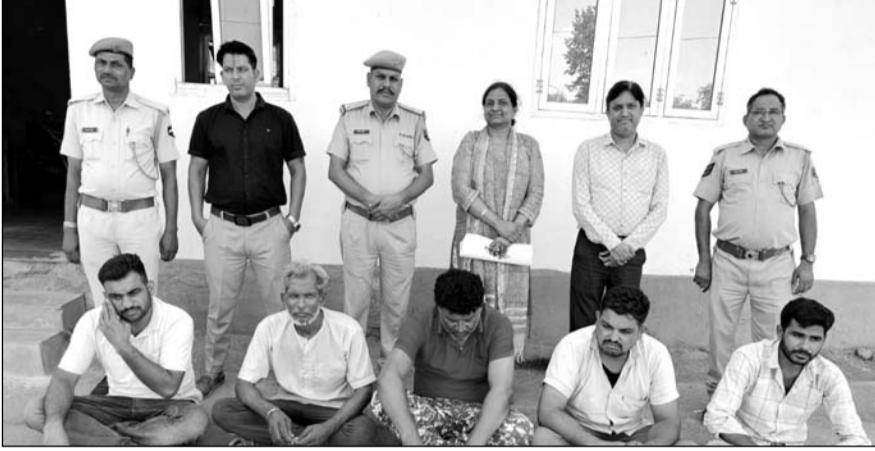
नसीराबाद पुलिस ने टैंकरों से अवैध रूप से गैस रीफिलिंग मामले में पांच जनों को हिरासत में लिया।