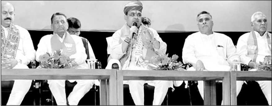
मुख्यमंत्री भजनलाल शर्मा ने भाजपा प्रत्याशी भागीरथ चौधरी के समर्थन में किशनगढ़ मार्बल एसोसिएशन सभागार में कार्यकर्ता सम्मेलन को संबोधित किया।

मदनगंज-किशनगढ़, (निस)। मुख्यमंत्री भजनलाल शर्मा ने भाजपा कार्यकर्ताओं को चुनावी परीक्षा में सफल होने के लिये जीत का मंत्र देते हुए कहा कि प्रधानमंत्री नरेंद्र मोदी के नेतृत्व में लोगों ने प्रचंड बहुमत के साथ भाजपा को जिताने का संकल्प ले लिया है, कार्यकर्ता एकजुटता के साथ प्रत्येक बूथ पर ऐतिहासिक जीत का लक्ष्य तय करें, ताकि प्रधानमंत्री मोदी के सपनों को साकार किया जा सके। मुख्यमंत्री सोमवार को भाजपा प्रत्याशी भागीरथ चौधरी के समर्थन में किशनगढ़ मार्बल एसोसिएशन सभागार में आयोजित कार्यकर्ता सम्मेलन को संबोधित कर रहे थे। उन्होंने कांग्रेस पर प्रहार करते हुए कहा कि दुकान बंद हो चुकी है, केवल झूठ के सहारे लोगों को गुमराह किया जा रहा है। प्रधानमंत्री नरेंद्र मोदी ने कश्मीर में धारा 370 हटाने के अलावा अयोध्या में भगवान श्रीराम को मंदिर में विराजमान करने का