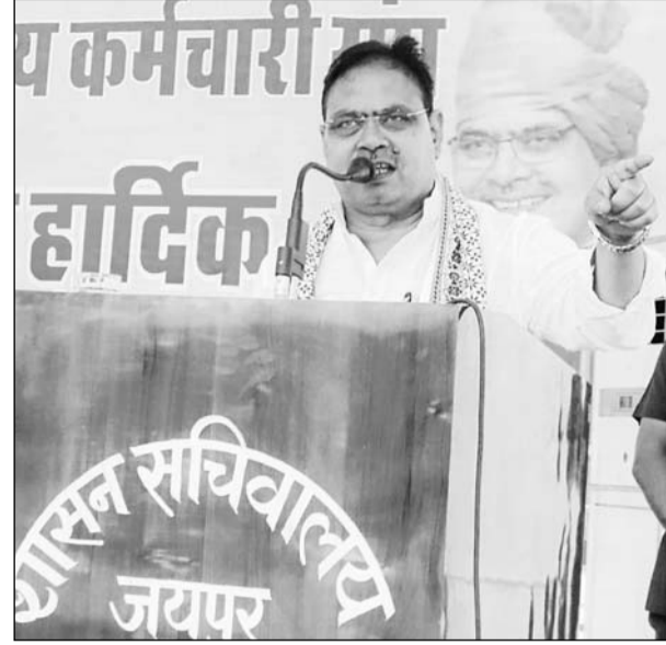
मुख्यमंत्री भजनलाल शर्मा ने गुरुवार को शासन सचिवालय में राजस्थान सचिवालय कर्मचारी संघ के शपथ ग्रहण समारोह को संबोधित किया।

शर्मा ने कहा कि सचिवालय में आधारभूत ढांचों के विकास कार्यों से अधिकारी व कर्मचारी स्वच्छ एवं सुगम कार्यस्थल पर काम कर पाएंगे। इसी क्रम में यहां बहुमंजिला मुख्य सचिव ब्लॉक, नॉर्थ ब्लॉक और साउथ ब्लॉक के निर्माण के लिए 275 करोड़ रुपये की स्वीकृतियां जारी कर दी गई हैं। 70 करोड़ की लागत से नॉर्थ ब्लॉक का निर्माण कार्य प्रगतिरत है। सचिवालय