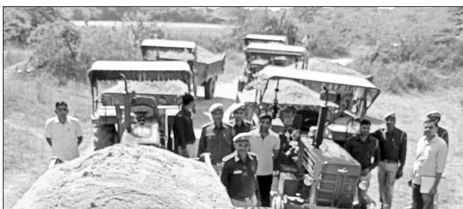
भीनमाल पुलिस ने अवैध खनन बजरी से भरे ट्रैक्टर ट्रॉली को जब्त किया।

भीनमाल, (निसं)। जालोर जिले के भीनमाल पुलिस ने बुधवार को अवैध बजरी खनन के मामले में छह ट्रैक्टर मय ट्रॉली जब्त किया।