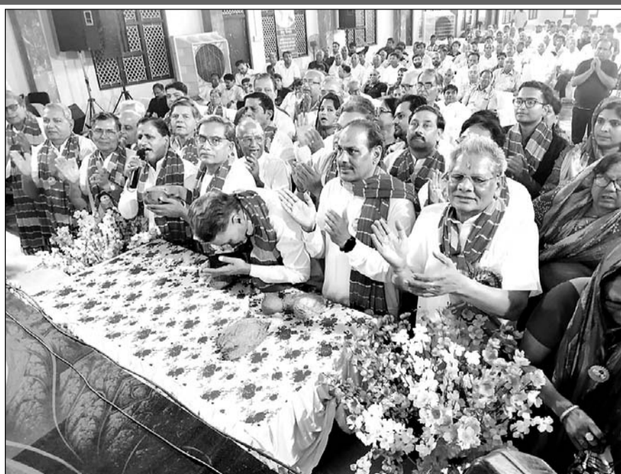
अखिल भारतवर्षीय धर्म जागृति संस्थान का सप्तम राष्ट्रीय अधिवेशन संपन्न हुआ।