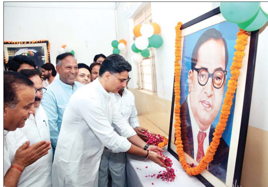
कांग्रेस के राष्ट्रीय महासचिव एवं पूर्व उपमुख्यमंत्री सचिन पायलट ने कहा कि भीमराव अंबेडकर द्वारा निर्मित संविधान आज भी पूरी तरह प्रासंगिक है और इसकी मूल भावना की रक्षा करना हम सभी का सामूहिक दायित्व है।

महिला आरक्षण सुनिश्चित करने के निर्णय की सराहना कर रही है। प्रधानमंत्री ने 14 अप्रैल को डॉ. भीमराव अंबेडकर की जयंती के अवसर पर उन्हें श्रद्धांजलि अर्पित करते हुए कहा कि संविधान के समानता और समावेश के मूल्यों पर चलते हुए, 16 अप्रैल से संसद में 'नारी शक्ति वंदन अधिनियम' पर चर्चा शुरू होगी। उन्होंने आने वाले संसद सत्र में इस संशोधन के पारित होने के लिए देशवासियों, विशेषकर महिलाओं से आशीर्वाद और समर्थन मांगा। प्रधानमंत्री ने विश्वास जताया कि पूरा सदन मिलकर इस ऐतिहासिक कदम को पारित करेगा, जिससे विधायी संस्थाओं में महिलाओं की भागीदारी सुनिश्चित होगी।