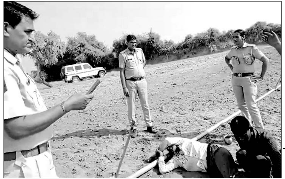
घटनास्थल का वीडियो सामने आया है, जिसमें खेत में एक व्यक्ति अचेत अवस्था पड़ा दिखाई दे रहा है।

गंभीर घायल को सूरजगढ़ के सरकारी अस्पताल में भर्ती करवाया, एक झुंझुं रेफर