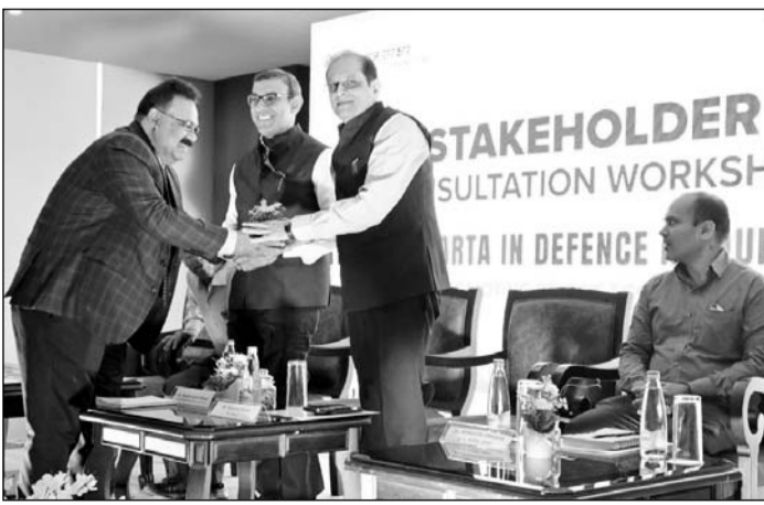
राज्य सरकार, रीको एवं इन्वेस्ट इंडिया के संयुक्त तत्वावधान में बुधवार को जयपुर में "रक्षा विनिर्माण में आत्मनिर्भरता" विषय पर कार्यशाला आयोजित हुई।