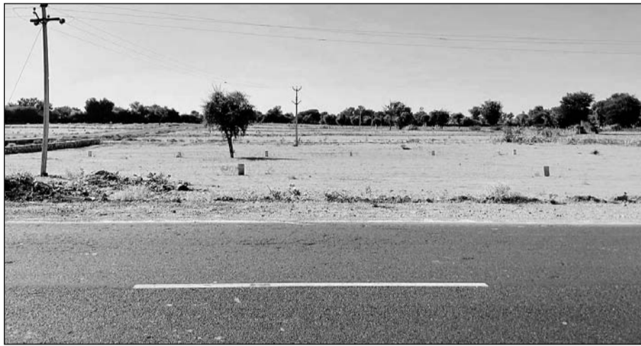
सायला उपखण्ड क्षेत्र के जीवाणा समेत आसपास के इलाकों में अवैध कॉलोनियां काटी जा रही हैं।

जानकारी के अनुसार राजस्थान भूमि राजस्व (ग्रामीणों क्षेत्रों में) भूमि का अ.पि प्रयोजनार्थ संपरिवर्तन) नियम 2007 के नियम 2 के तहत आवासीय भूखण्ड, प्लेट, गृह डवलपमेंट की ओर से डवलप करके ही बेचा जा सकता है। आवासीय भूखण्ड को संपरिवर्तन करवाने का तहसीलदार को ढाई बीघा (4000 वर्ग मी.) और आवासीय कॉलोनी या प्रोजेक्ट के लिए 10000 वर्ग मी.) तक भूमि को संपरिवर्तन का अधिकार है। वहीं आवासीय कॉलोनी में कुल भूमि का 60 फीसदी आवास उपयोग के लिए आरक्षित है। शेष 40 फीसदी भूमि सरकार को सुपुर्द करनी होती है। जिसमें सड़क, बगीचा आदि विकसित करने होते हैं। लेकिन जीवाणा क्षेत्र में राजस्व नियमों के विपरीत अधिकांश